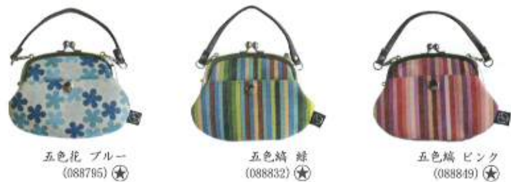
五色花 ブルー (088795)★

¥3,500 (税抜) 約12cm×15cm 綿100% (持ち手:合成皮革) 日本製