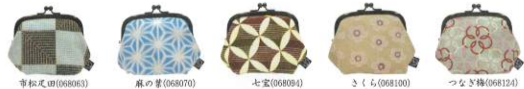
市松尺田(068063) 麻の葉(068070) 七宝(068094) さくら(068100) つなぎ梅(068124)