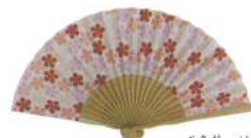
五色花 ピンク (110687)★