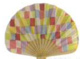
五色市松 パステル (110700)★