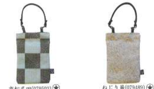
市松尺田(079502)★ ねじり菊(079489)★