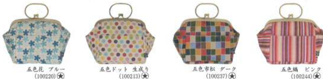
五色花 ブルー (100220)★