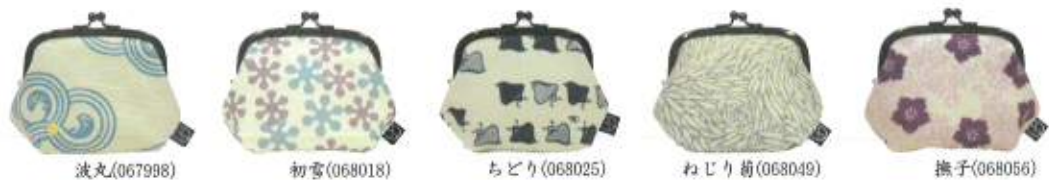
波丸(067998) 初雪(068018) ちどり(068025) ねじり菊(068049) 撫子(068056)

始まりはここから。伝統を身近に…と作り出した 五色帆布堂の誕生当時から愛され続けるシリーズです。