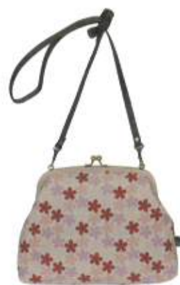
五色花 ピンク (100176)★

¥5,800 (税抜) 約22cm×25cm×8cm 綿100% (角ひも:合成皮革) 日本製