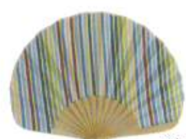
五色菊 緑 (110724)★