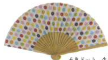
五色ドット 生成り (110663)★