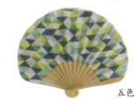
五色菊 緑 (110748)★