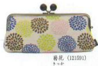
菊花 (121591) きくが

『和の花』をモチーフにしたシリーズです。 温かみを感じるウッドビーズ付きの口金を使用しています。