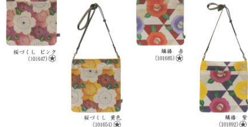
桜づくし 黄色 (101654)★ 罌粟 紫 (101692)★

¥6,000 (税抜) 約26cm×23cm×2cm 綿100% (肩ひも:合成皮革) 日本製