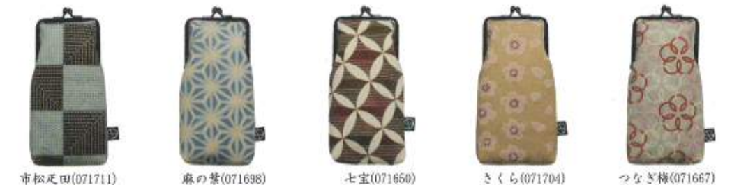
市松尺田(071711) 麻の葉(071698) 七宝(071650) さくら(071704) つなぎ梅(071667)