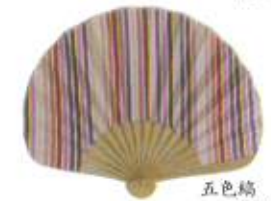
五色菊 ピンク (110731)★