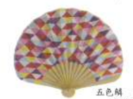
五色菊 ピンク (110755)★