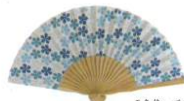
五色花 ブルー (110670)★

¥2,500 (税抜) 約21cm×38cm 扇面/綿100% 扇骨/竹 中国製