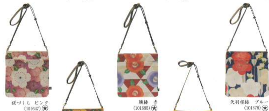
桜づくし ピンク (101647)★ 罌粟 赤 (101685)★ 矢羽根梅 ブルー (101678)★