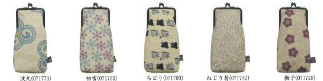
波丸(071773) 初雪(071735) ちどり(071780) ねじり菊(071742) 撫子(071728)