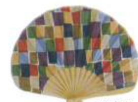
五色市松 デーク (110717)★