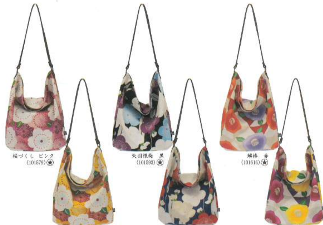
桜づくし ピンク (101579)★ 矢羽根梅 黒 (101593)★ 罌粟 赤 (101616)★

大正時代を彷彿とさせる極彩色の和文様。 懐かしくて新しい、遊び心を感じる華やかなシリーズです。