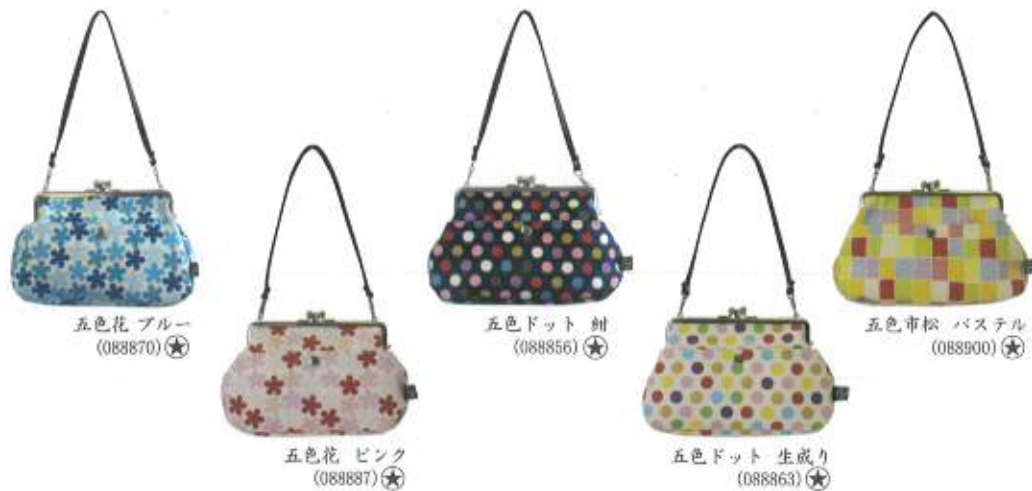
五色花 ブルー (088870)★

¥3,800 (税抜) 約14.5cm×23cm×7cm 綿100% (角ひも:合成皮革) 日本製