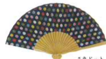
五色ドット 紺 (110656)★