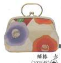
罌粟 赤 (101548)★