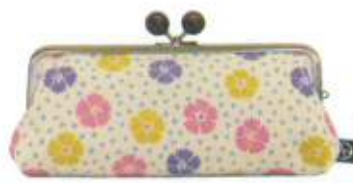
淡彩撫子 (121621) たんさいなでしこ