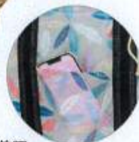
前面 ミニオープンポケット