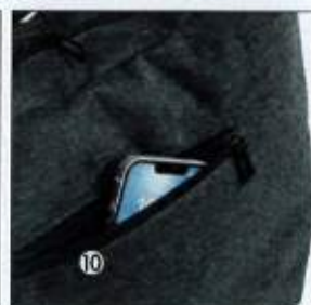
背面ファスナーポケット