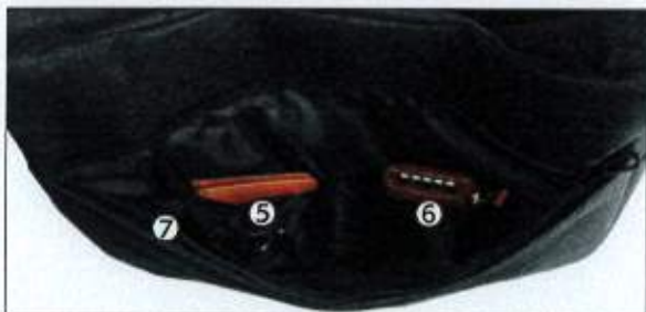
前面ファスナーポケット