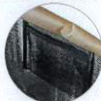
保冷剤用 メッシュポケット