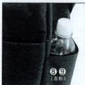
サイドオープンポケット (両側)