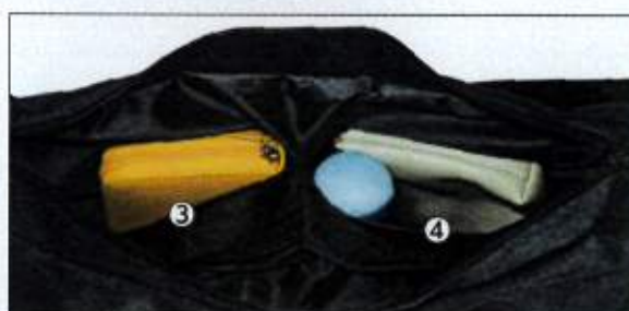
内側オープンポケット