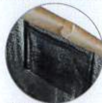
保冷剤用 メッシュポケット