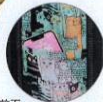
前面 ミニオープンポケット