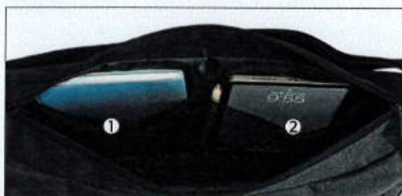
内側メッシュオープンポケット