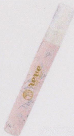
ラベル張り替えイメージ